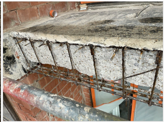
Barst thv boring ~ wapening vrijmaken