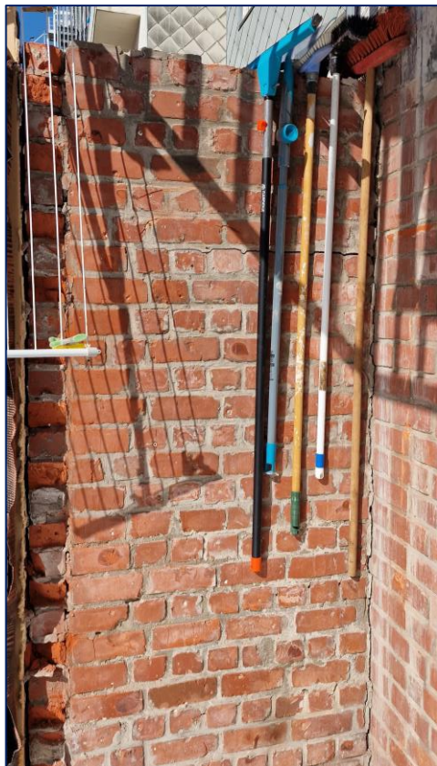
3 Scheidingsmuur links metselwerk gescheurd