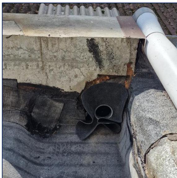
10 Plaatsing nieuw verlaagd tapgat in uitvoering

Eerder gemaakte opmerkingen door de aannemer te bevestigen dat ze uitgevoerd of aangepast werden.