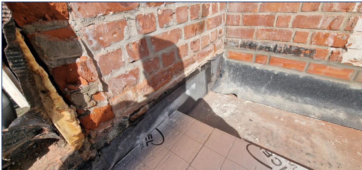
1 Onderkapping thv. de berging links is uitgevoerd. De scheidsmuur dient nog voorzien te worden van een Z-profiel (Solin)