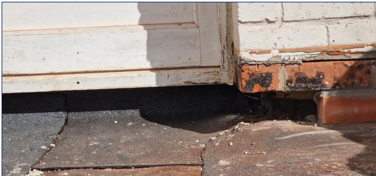
7 Deur rechts: Waterdichting zo hoog mogelijk opgetrokken. Onderkapping af te werken.