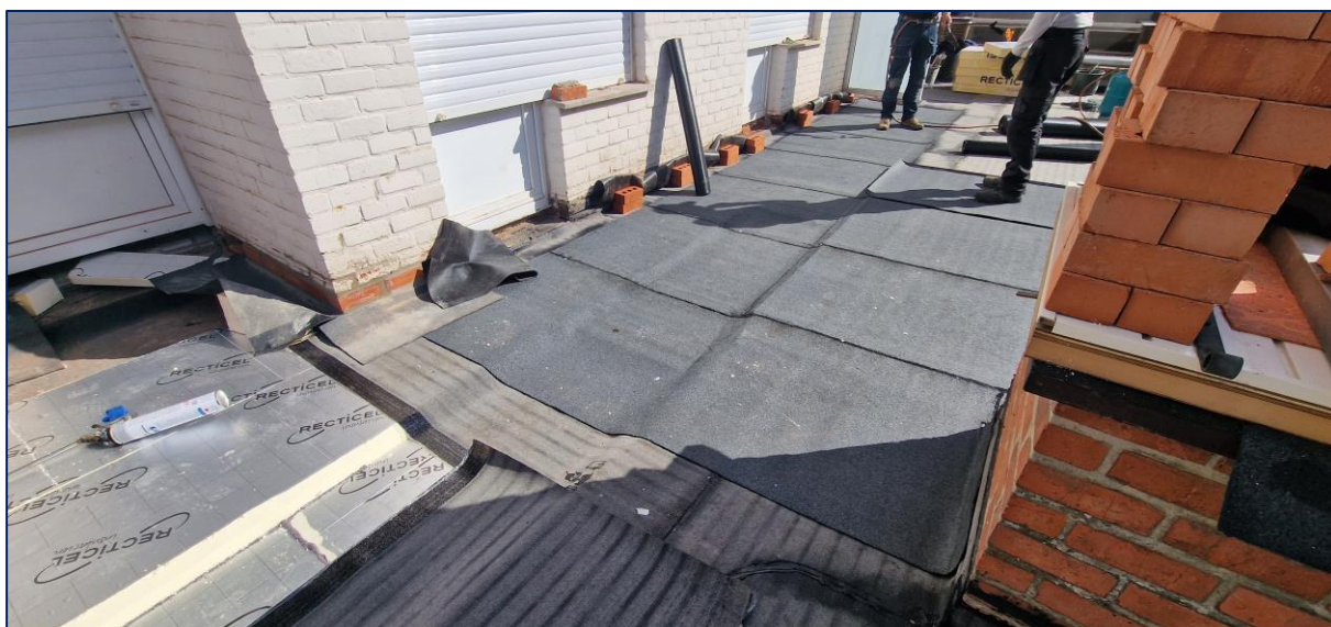
4 Uitgewerkte goot richting tapgat

Eerder gemaakte opmerkingen door de aannemer te bevestigen dat ze uitgevoerd of aangepast werden.