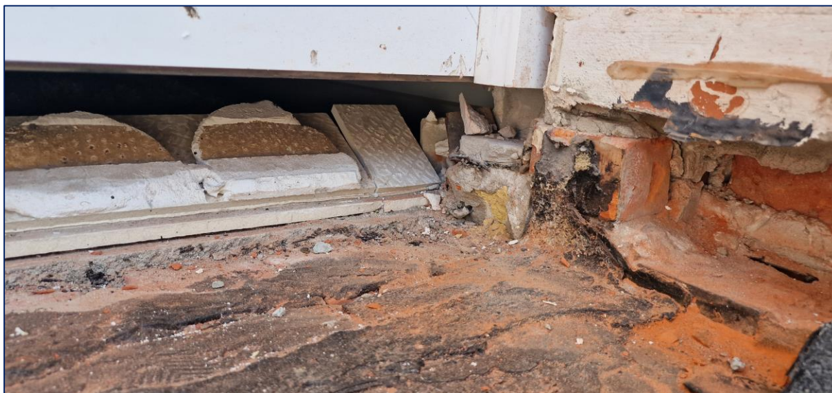
8 Deur links: Geen opstand na verwijderen dorpel. Toegang via appartement vereist!

Eerder gemaakte opmerkingen door de aannemer te bevestigen dat ze uitgevoerd of aangepast werden.