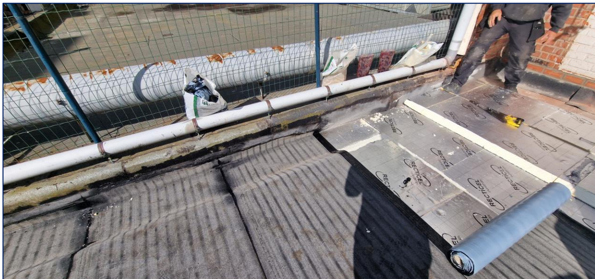
5 Uitwerking goot / bitumineuze dichting zo hoog mogelijk tot tegen RWA optrekken. Verankeringen aan te werken met PMMA