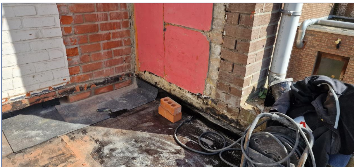
2 Onderkapping thv. berging rechts in uitvoering. de scheidsmuur te voorzien van Z-profiel (Solin)

Eerder gemaakte opmerkingen door de aannemer te bevestigen dat ze uitgevoerd of aangepast werden.