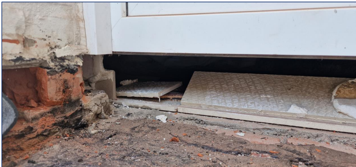
9 Deur links: Geen opstand na verwijderen dorpel. Toegang via appartement vereist!