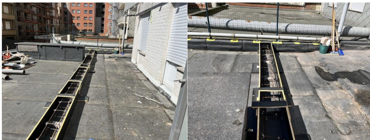
Bekisting en wapeningskorf zijn geplaatst, maar wapeningskorf dient nog verstevigd te worden ...

Eerder gemaakte opmerkingen door de aannemer te bevestigen dat ze uitgevoerd of aangepast werden.