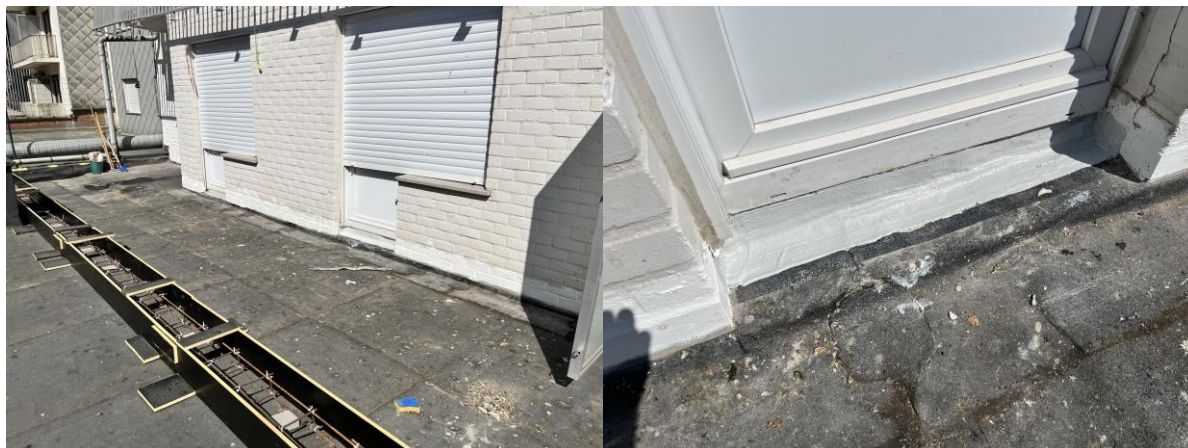
De dichting is aan alle deuren aangewerkt met PMMA-hars met wapeningsvlies ...