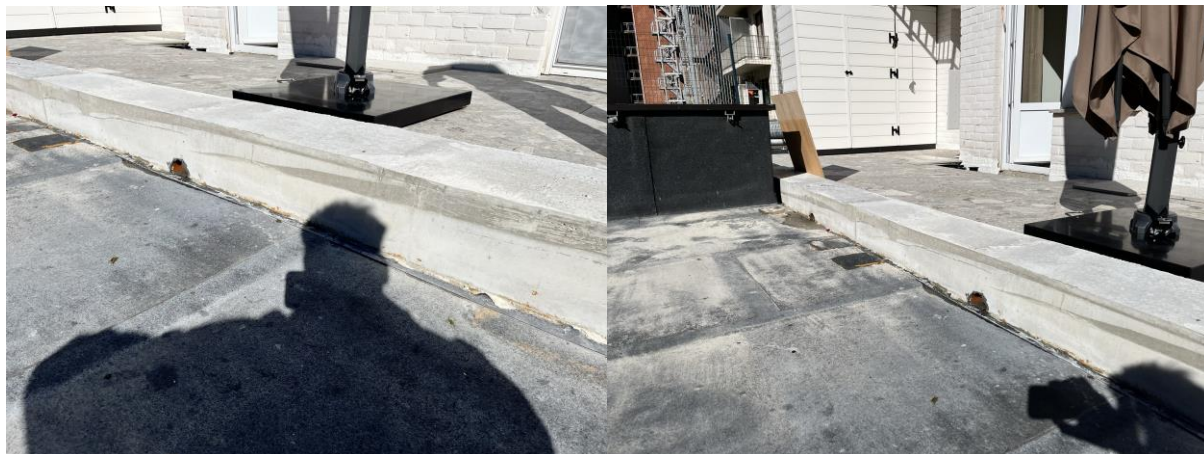
De sokkel is gegoten, en ontdaan van de bekisting, de balustrade kan erop geplaatst worden ...