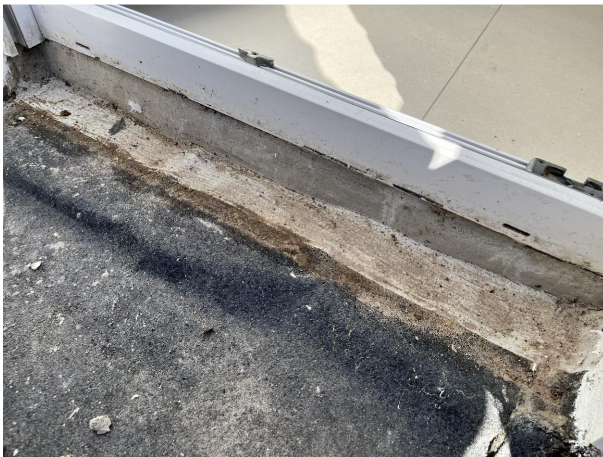
De mortel onder de deur verhindert een correcte afwatering en dient dus weer verwijderd te worden ...

Eerder gemaakte opmerkingen door de aannemer te bevestigen dat ze uitgevoerd of aangepast werden.